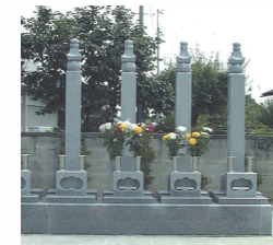
一石五輪塔夫婦墓