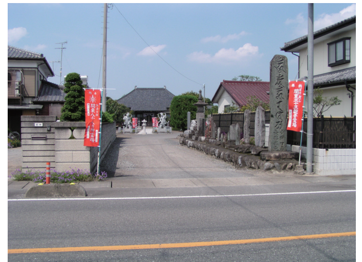
国道140号(旧道)入口 右→熊谷方面

秩父鉄道小前田駅を南に出て駅前を左折、道なりに東へ約10分で花園小学校があります。 花園小学校の校庭の南側に長善寺墓地があり、墓地へ入る細い道があり、本堂裏手に進入します。 小前田駅より徒歩約15分です。