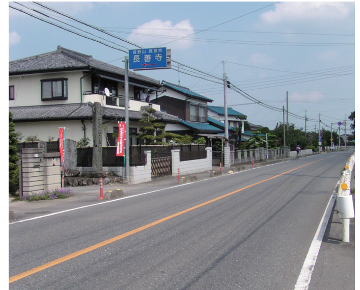
国道140号(旧道)入口標識 奥が熊谷方面