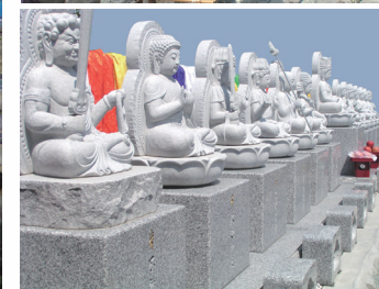
本堂前の十三仏さま