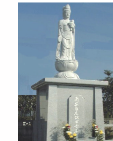
永代供養塔合祀墓